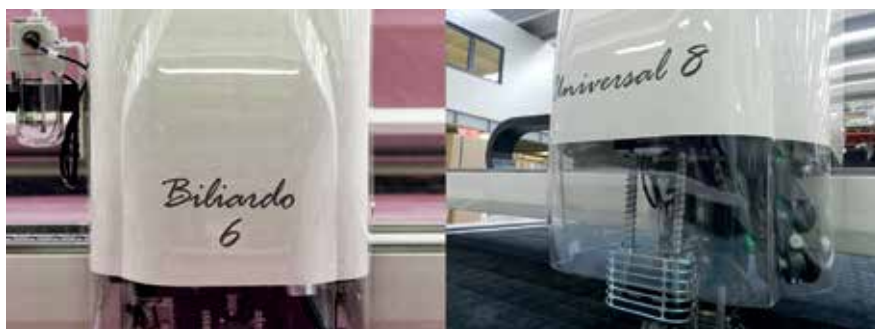
Головки раскройных машин Biliardo и Universal

Ко дню рождения Флавио Каттини было подготовлено специальное двухдневное торжество — «Конференция для стран Европы и Средиземноморья»,