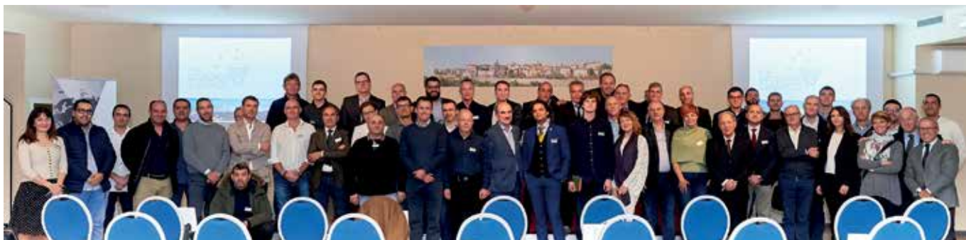
Коллективная фотография участников семинара

финансовой устойчивости и надежности компании.