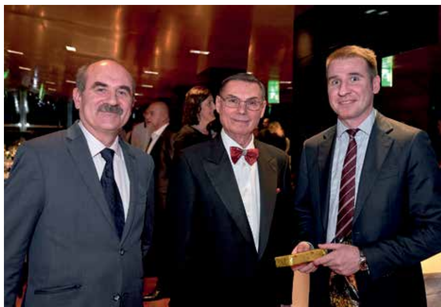
Авторизованные дилеры FK в России: КОМТЕНС и президент FKgroup

быть прозрачны, особенно отношения с поставщиками, партнерами и дилерами. Надо отметить, что FKgroup всегда подходила очень ответственно к установлению отношений с дилерами: у компании, представляющей интересы FK, должны быть хорошая репутация, соответствующие квалифицированные кадры, технические специалисты компании-дилера должны проходить обучение на заводах FK, быть связующим звеном в цепочке производитель-дилер-пользователь. В том же 2017 году компании был присвоен кредитный рейтинг доверия B1.1 по данным европейского рейтингового агентства Cerved Rating, что свидетельствует о стабильной