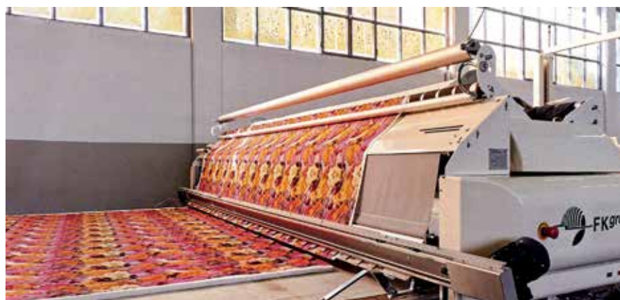
Настилочная машина для домашнего текстиля

По всем вопросам приобретения автоматизированных настилочно-раскройных комплексов (АНРК) FKgroup просьба обращаться в офисы российского дилера — КОМТЕНС.