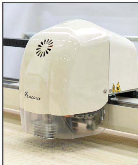
Резка настила толщиной от одного слоя до 2,5 см в сжатом виде

Место оператора: Оператор находится в начале координаты Y раскладки ТВР: температура от 10°C до 40°C, влажность до 80% без конденсата Стандарты: CE, UNI EN 292/1, 292/2, 349, 294 шум < 60 дБ