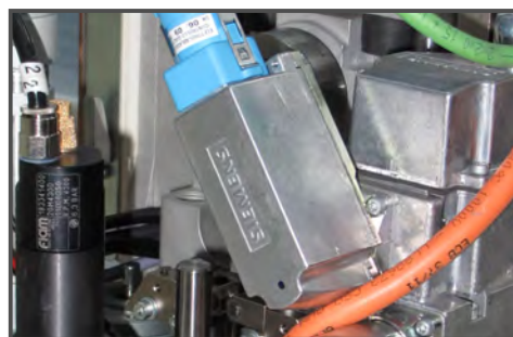
За счёт использования в системе бесщёточных моторов и модулей управления от мировых лидеров, таких как Siemens, обеспечивается высокая надёжность установки